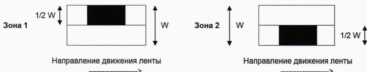
Рисунок 1 — Расположение испытательных нагрузок при оценке погрешности в режиме динамического взвешивания объектов измерений при их нецентрированном положении при движении по конвейерной ленте

зона 2 — от центра ГПУ к противоположному краю транспортной системы.