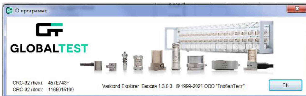
Рисунок 2 – Пример окна с информацией о ПО

Для вызова окна с информацией о версии ПО и результатов расчета цифрового идентификатора необходимо в строке меню выделить пункт «О программе». Пример всплывающего окна приведен на рисунке 2.