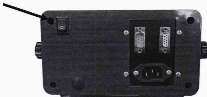
Рисунок 1 – Схема пломбировки от несанкционированного доступа и обозначение места для нанесения оттиска клейма

Знак поверки в виде клейма наносится на пломбу, предотвращающую несанкционированное вмешательство (рисунок 1).