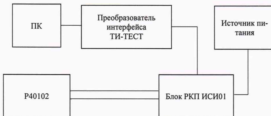
Рисунок 1 - Схема опробования

Примечание – напряжение питания постоянного тока здесь и далее контролировать с помощью мультиметра цифрового Fluke 87V.