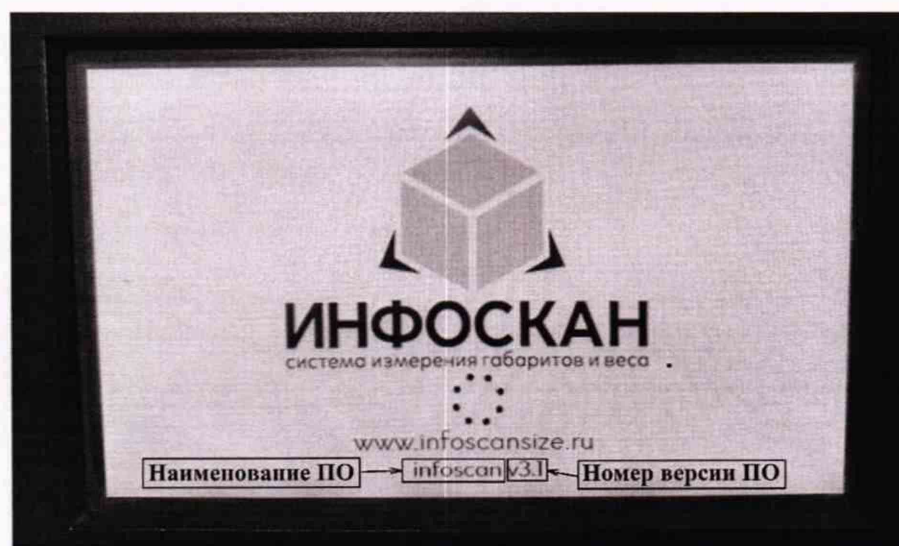
Рисунок 1 – Загрузочный экран блока обработки и отображения информации