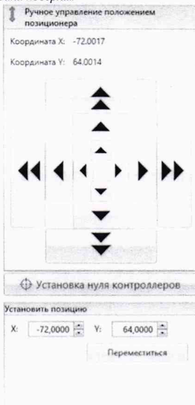
Рисунок 2 – Меню программы для ручного управления движением сканера

Перемещая антенну-зонд с установленным оптическим отражателем вдоль осей Ox и Oy (вертикальная плоскость сканирования) в пределах рабочей зоны сканера с шагом \lambda_{min}/2 (где \lambda_{min} - минимальная длина волны, соответствующая верхней границе диапазона рабочих частот комплекса, до срабатывания механического ограничителя), фиксировать показания системы Leica Absolute Tracker AT401.