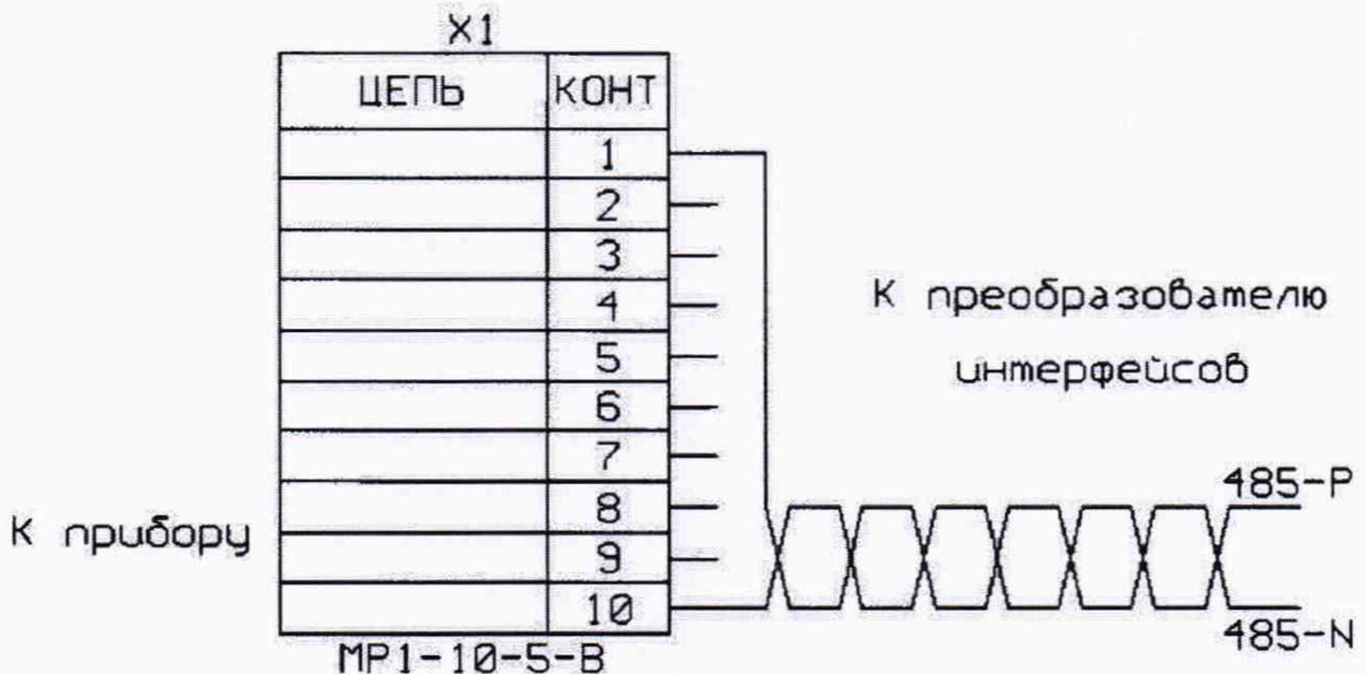
Рисунок 1 - Монтажная схема кабеля

- установить связь с газосигнализатором, для этого в верхней части открывшегося окна с программой, в окне «Адрес прибора» установить номер данного экземпляра (ввести трехзначный номер газосигнализатора с задней стенки корпуса прибора, если его значение находится в диапазоне от 1 до 247, иначе первая цифра номера заменяется на единицу), в выпадающем меню выбрать команду «Подключение», а в открывшемся списке, выбрать