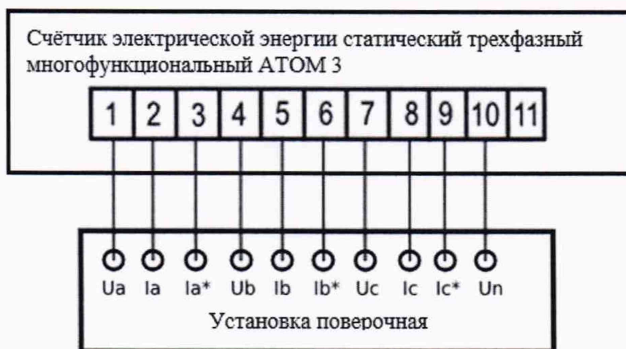
Рисунок 1 – Схема подключения к поверочной установке