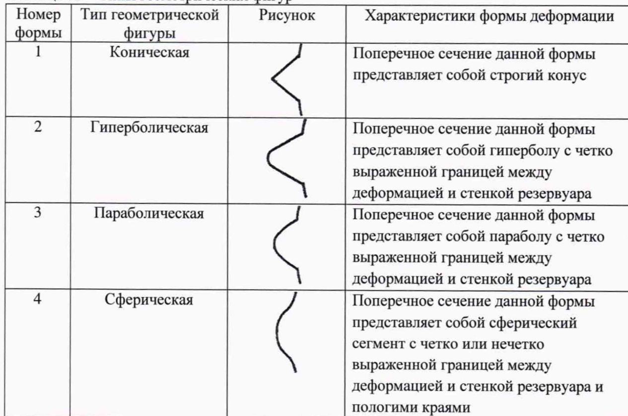
Таблица 10 – Типы геометрических фигур

9.6.1 Определяют тип геометрической фигуры, которому соответствует форма деформации днища и стенок резервуара (эллипс, гипербола, сферический сегмент, конус, параболический сегмент) в соответствии с таблицей 10.