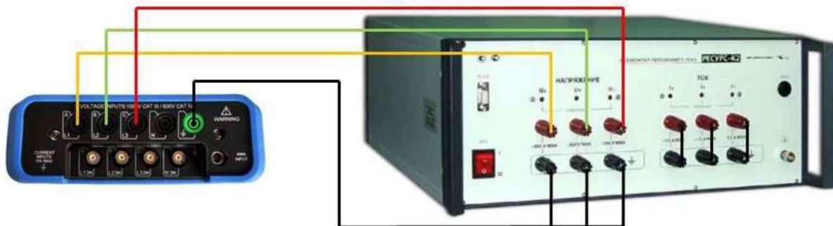
Рисунок 6 – Схема подключения приборов при определении погрешности измерения значений и длительности провалов и выбросов напряжения, коэффициента несимметрии напряжений, угла фазового сдвига между напряжениями основной частоты

10.13.1 Подключить анализатор к калибратору Ресурс-К2 в соответствии с рисунком 6.