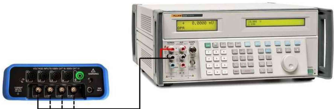
Рисунок 2 – Схема подключения приборов при определении погрешности измерения силы переменного тока без использования токовых преобразователей.

10.4.1 Подключить токовый вход L1 анализатора к калибратору Fluke 5522A при помощи кабеля BNC-banana в соответствии с рисунком 2.