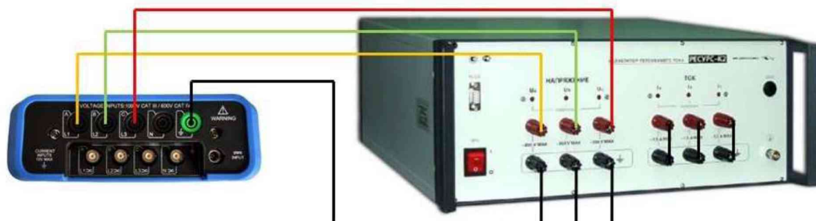
Рисунок 4 – Схема подключения приборов при определении погрешности измерения коэффициента n-ой гармонической составляющей напряжения, угла фазового сдвига между гармоническими составляющими напряжения

10.9.1 Подключить потенциальный вход L1 анализатора к калибратору Ресурс-К2 в соответствии с рисунком 4.