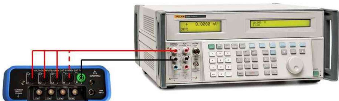
Рисунок 1 – Схема подключения приборов при определении погрешности измерения напряжения, частоты, дозы фликера

10.1.1 Подключить входы L1, L2, L3 анализатора к калибратору Fluke 5522A в соответствии с рисунком 1.