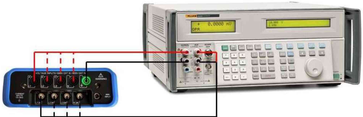
Рисунок 3 – Схема подключения приборов при определении погрешности измерения мощности и коэффициента мощности

10.6.1 Подключить вход L1 анализатора к калибратору Fluke 5522A в соответствии с рисунком 3.