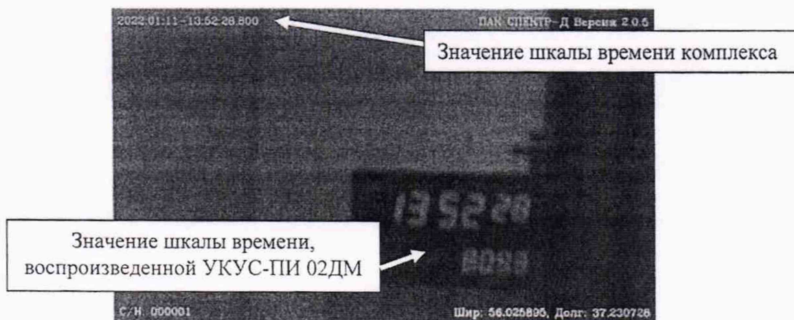
Рисунок 2 — Кадр, полученный комплексом

10.1.5 С помощью интерфейса ПО комплекса сделать не менее 5 кадров индикатора времени «ИВ-1» в течении 30 минут в соответствии с рисунком 2.