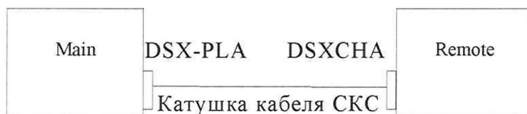
Рисунок 2 – Схема соединения анализатора при определении абсолютной погрешности измерений длины кабеля

где L_{изм} – результат измерений длины кабеля анализатором, м; L_d – результат измерений длины кабеля измерителем, м.