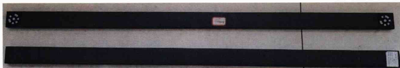
Рисунок 2 - Общий вид специальной измерительной меры