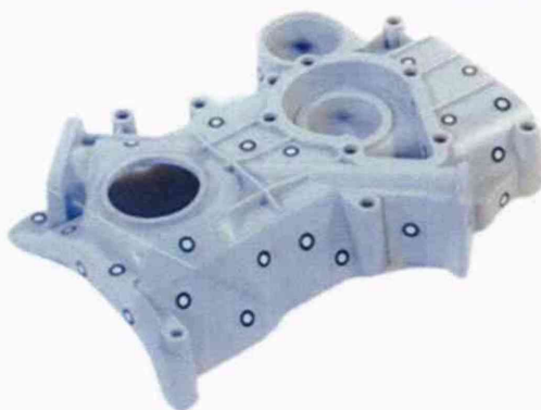
Рисунок 1 - Общий вид меток и пример их нанесения на объект сканирования.