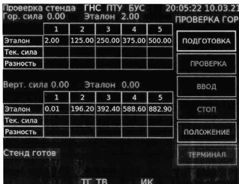
Рисунок 1 – Вид экрана БУР в режиме проверки ЭД, установленного для измерений горизонтальной нагрузки

10.1.1.3 С помощью навигационной панели блока управления и регистрации (далее по тексту – БУР) перейти в на вкладку «МЕТРОЛОГИЯ» и выбрать пункт меню «ПРОВЕРКА ГОР», после чего откроется экран, представленный на рисунке 1.