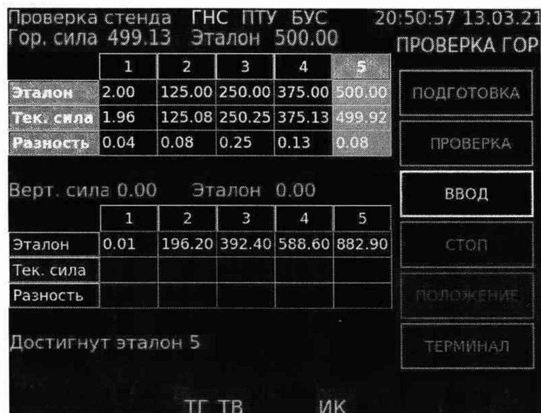
Рисунок 3 – Диалоговое окно БУР после проведения проверки ЭД, установленного для измерений горизонтальной нагрузки

10.1.1.7 Переместить опорную плиту приспособления в первоначальное положение и снять ЭД.