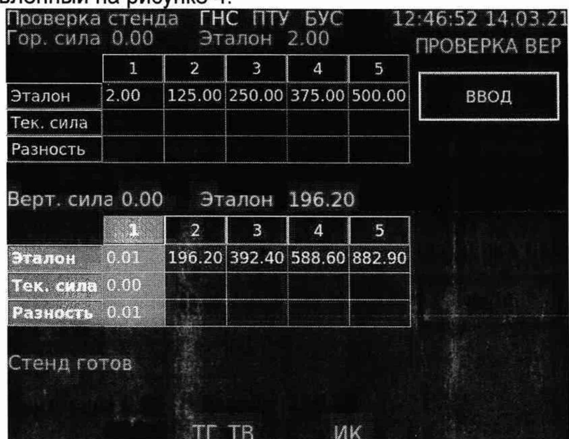
Рисунок 4– Диалоговое окно БУР перед началом проверки ЭД, предназначенного для измерений вертикальной нагрузки

10.1.2.1 С помощью навигационной панели БУР перейти в на вкладку «МЕТРОЛОГИЯ» и выбрать пункт меню «ПРОВЕРКА ВЕР», после чего откроется экран, представленный на рисунке 4.