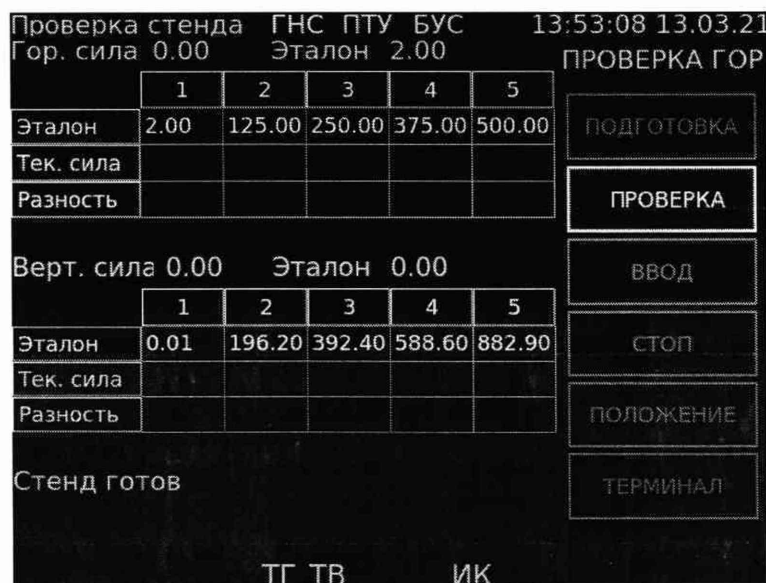
Рисунок 2 – Диалоговое окно БУР перед началом проверки ЭД, предназначенного для измерений горизонтальной нагрузки

Выбрать пункт меню «ПРОВЕРКА» и нажать кнопку «ВВОД». При этом опорная плита приспособления начнёт перемещаться до тех пор, пока текущее значение горизонтальной силы не приблизится к значению ЭД в точке 1.