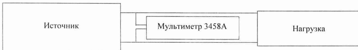
Рисунок 1 – Структурная схема определения абсолютной погрешности измерений/установки напряжения постоянного тока

1) собрать схему, приведенную на рисунке 1;