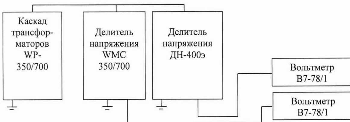
Рисунок 1 - Схема измерений напряжения переменного тока до 400 кВ

9.1.8 По окончании измерений снимите высокое напряжение, отключите и заземлите установку.