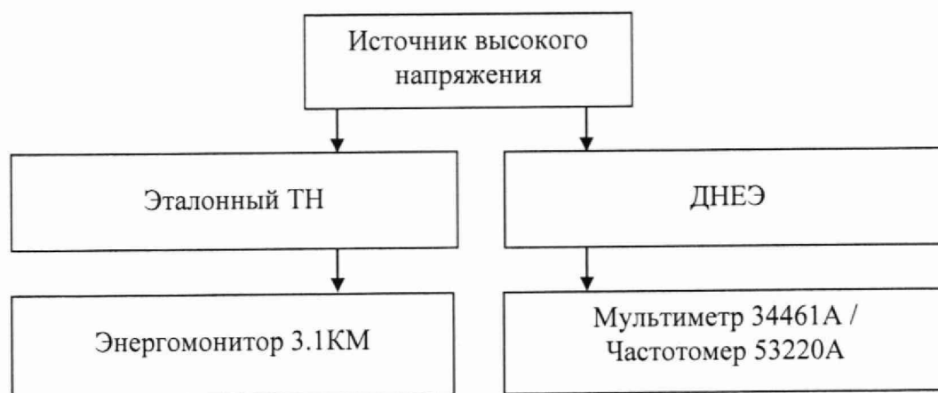
Рисунок 1. Схема для определения погрешности коэффициента масштабного преобразования напряжения переменного тока ДНЕЭ, оснащенного аналоговыми выходами

8.3.1.1 Собирают схему подключений согласно рисунку 1 в соответствии с эксплуатационной документацией.