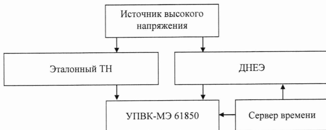
Рисунок 2. Схема для определения погрешности коэффициента масштабного преобразования и угла фазового сдвига напряжения переменного тока ДНЕЭ, оснащенного цифровыми выходами

8.3.2.1 Собирают схему подключений согласно рисунку 2.