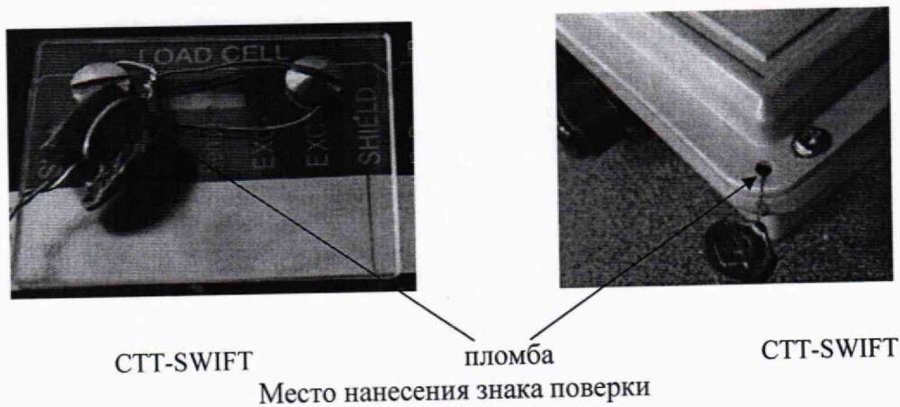
Рисунок 3 Схема пломбировки от несанкционированного доступа, обозначение мест нанесения знака поверки В случае установки терминалов в защитный ящик, пломбируется лицевая панель защитного (приборного) ящика.

Руководитель сектора испытаний ЗАО КИП «МЦЭ»