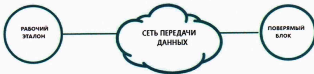
Рисунок 3 – Схема измерений диапазона и абсолютной погрешности измерений количества информации (объема данных)

10.6.1 Собрать схему в соответствии с рисунком 3.