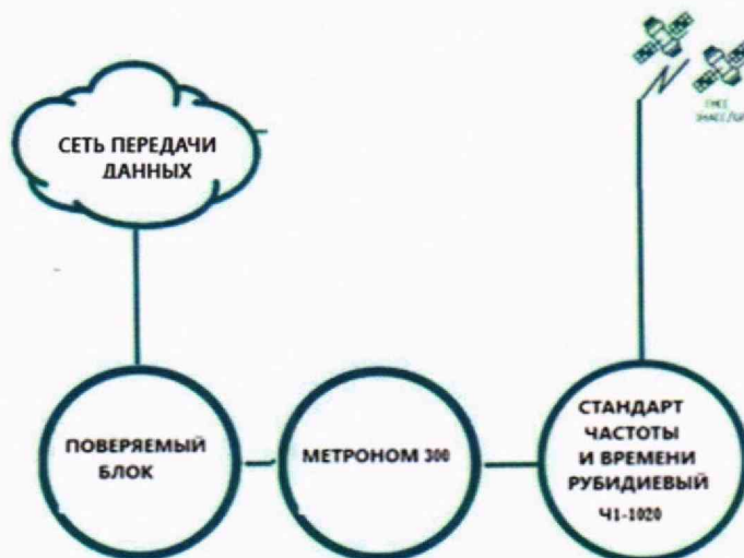
Рисунок 2 – Схема измерения погрешности измерения разности (расхождения) шкал времени

Подключение и работу с оборудованием: стандарт частоты и времени рубидиевый Ч1-1020 и устройство синхронизации частоты и времени Метроном 300 проводить в соответствии с их руководствами по эксплуатации.