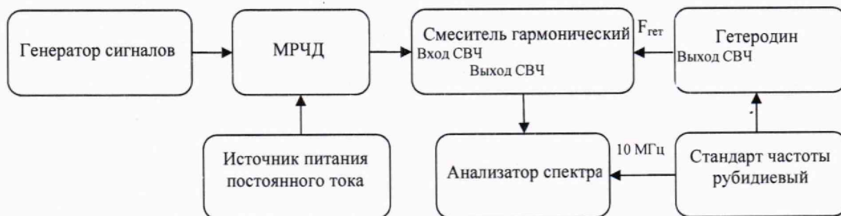
Рисунок 1 – Схема определения относительной погрешности установки частоты выходного сигнала

9.1.1.2 Собрать схему в соответствии с рисунком 1.