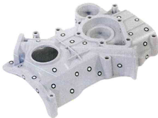
Рисунок 1 - Общий вид меток и пример их нанесения на объект сканирования.

- нанести светоотражающие (рефлекторные) метки (пример данных меток приведен на рисунке 1) на компаратор вдоль оси перемещения каретки согласно эксплуатационной документации на прибор;