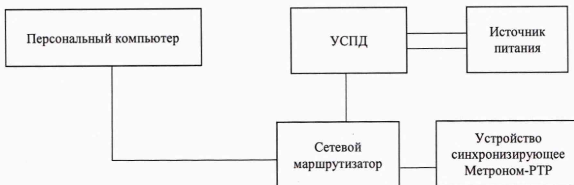
Рисунок 1 – Схема подключения