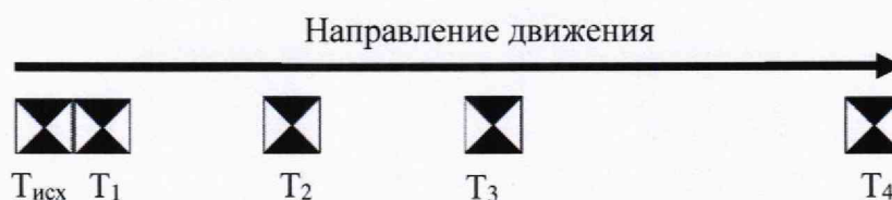
Рисунок 1 – Схема расположения марок

- для проведения измерений сканером модификаций 100, 100+ установить четыре марки в зоне проведения работ, таким образом, чтобы расстояние от исходной точки T_{исх} до контрольных точек T_1, T_2, T_3, T_4 составляло 0,05, 25±10, 50±10, 100 м; для модификаций 100 LITE, 200+, 200 ULTRA, HI-RES расстояние между исходной точкой T_{исх} и контрольной точкой T_1 должно составлять 0,5 м, в соответствии со схемой, представленной на рисунке 1;