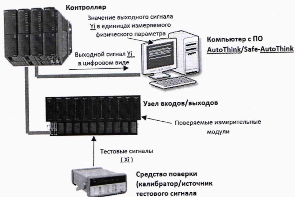
Рисунок 1 – Схема поверки модулей измерительных систем управления LK(S)

При этом способе в соответствии с руководством по эксплуатации должна быть собрана схема системы управления LK(S), включающая, как минимум: контроллер, узел входов/выходов и компьютер с установленным ПО (AutoThink или Safe-AutoThink). Поверяемые модули измерительные должны быть установлены в соответствующие слоты узла входов/выходов и сконфигурированы в соответствии с руководством по эксплуатации и требованиями пользователя.