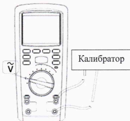
Рисунок 3 – Схема подключений для определения абсолютной основной погрешности измерений напряжения переменного тока

1) Подключить к измерительным входам мегаомметра калибратор в соответствии с рисунком 3.