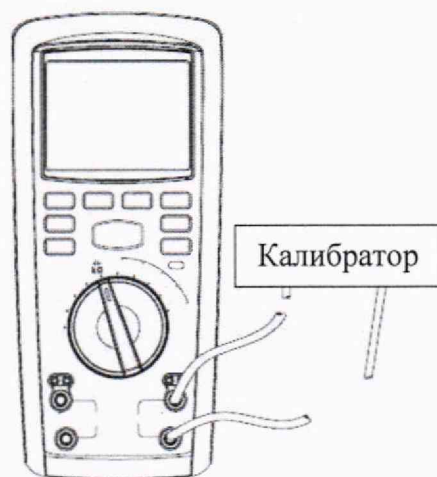
Рисунок 7 – Схема подключений для определения абсолютной основной погрешности измерений электрического сопротивления постоянному току (свыше 100 Ом), абсолютной основной погрешности измерений электрической емкости для мегаомметров модификации RGK RT-32

2) Перевести калибратор в режим воспроизведений электрического сопротивления постоянному току.