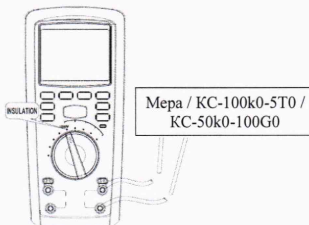
Рисунок 2 – Схема подключений для определения абсолютной основной погрешности измерений сопротивления изоляции