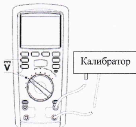
Рисунок 4 – Схема подключений для определения абсолютной основной погрешности измерений напряжения постоянного тока