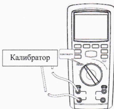
Рисунок 6 – Схема подключений для определения абсолютной основной погрешности измерений электрического сопротивления постоянному току для мегаомметров модификации RGK RT-32 (для значений электрического сопротивления постоянному току от 0,01 до 100 Ом)