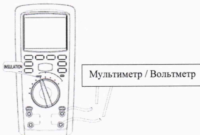
Рисунок 1 – Схема подключений для проверки диапазона установки испытательного напряжения постоянного тока