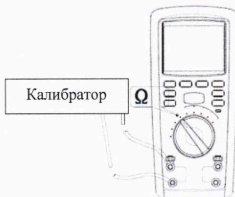
Рисунок 5 – Схема подключений для определения абсолютной основной погрешности измерений электрического сопротивления постоянному току для мегаомметров модификации RGK RT-30