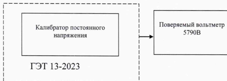
Рисунок 3 - Схема соединения приборов при определении основной погрешности вольтметра в режиме измерений постоянного электрического напряжения

9.2.1 Передачу единицы постоянного напряжения от государственного первичного эталона, применяемого при поверке, выполняют методом непосредственного сличения поверяемого вольтметра с государственным первичным эталоном, с помощью калибратора постоянного напряжения. Соберите схему соединения приборов в соответствии с рисунком 3. Определение основной погрешности вольтметра в режиме измерений постоянного электрического напряжения проводится во всех точках, указанных в таблице 4.