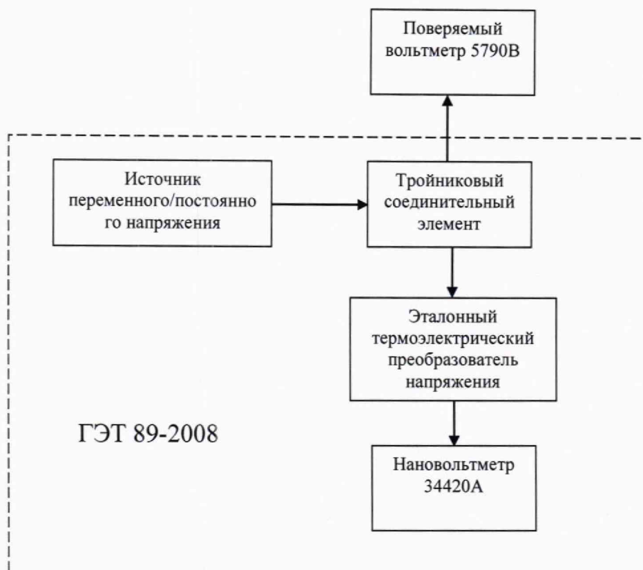
Рисунок 2 - Схема соединения приборов при определении основной погрешности вольтметра в режиме измерений переменного электрического напряжения.

9.1.2 Подать от источника переменного/постоянного напряжения из состава ГЭТ 89-2008 на вход тройникового соединителя переменное напряжение 1 В частотой 1 кГц. Зафиксировать показание нановольтметра 34420А, измеряющего значение термоЭДС e_{1\text{ кГц}} на выходе эталонного преобразователя напряжения и показания поверяемого вольтметра U_{1\text{ кГц}} .