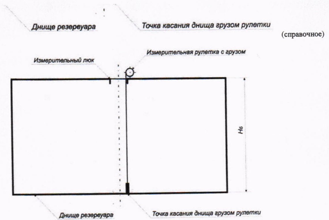
Рисунок А. 1 - Схема измерения базовой высоты резервуара и эталонного расстояния уровнемера