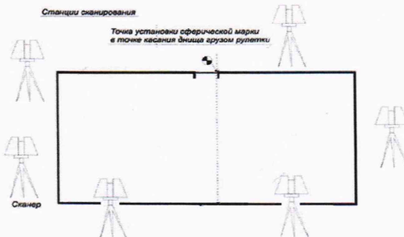
Рисунок А.3 - Схема сканирования внешней поверхности резервуара