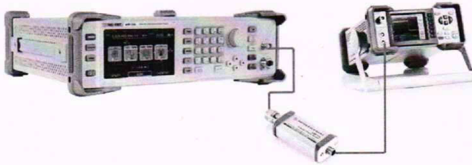
Рисунок 5 – Схема соединения приборов для определения неравномерности АЧХ встроенного НЧ генератора

9.6.4 Не меняя уровень на генераторе, провести измерение уровня мощности ваттметром, изменяя частоту сигнала на генераторе. Частота выбирается из ряда 100; 200; 300; 400; 500; 600; 700; 800; 900; 1000 кГц.