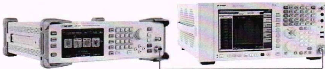
Рисунок 3 – Схема соединения приборов для определения погрешности установки выходного уровня генератора в диапазоне уровней от -30 до -110 дБм и параметров спектра

\Delta P – корректирующая поправка, рассчитанная по формуле (3).