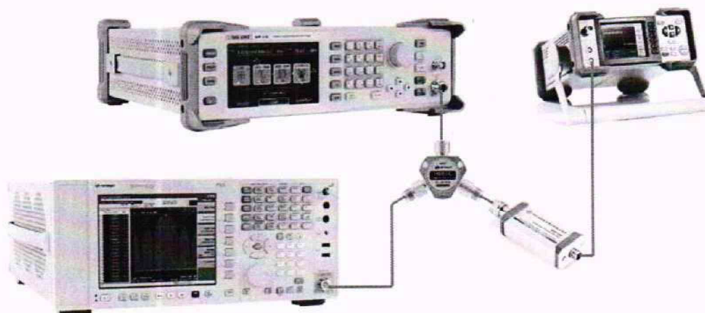
Рисунок 2 – Схема соединения приборов для определения погрешности установки выходного уровня генератора с использованием анализатора спектра N9030A

9.2.8 Для определения частотной поправки соединительного кабеля, используемую в дальнейшем при измерении погрешности установки уровня выходной мощности с использованием анализатора спектра N9030A, собрать измерительную схему в соответствии с рисунком 2. В зависимости от частотного диапазона генератора, для определения частотной поправки использовать или только ваттметр поглощаемой мощности NRP18A или ваттметр поглощаемой мощности СВЧ N8485A, на частотах свыше частотного диапазона NRP18A.