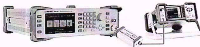
Рисунок 1 – Схема соединения приборов для определения погрешности установки выходного уровня генератора в диапазоне уровней от +20 до -20 дБм

9.2.3 Установить значение фиксированной частоты 1,33 МГц и уровень выходной мощности +20 дБм.