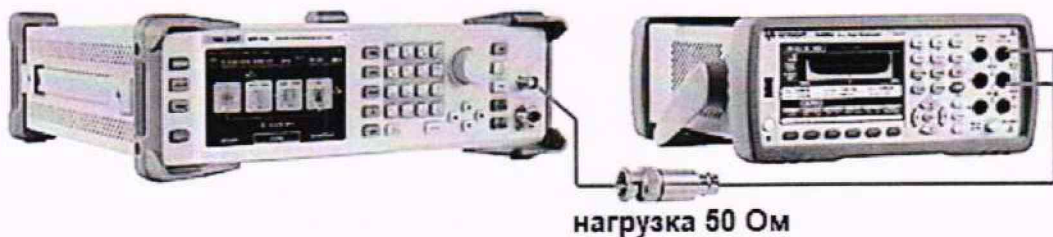
Рисунок 6 – Схема соединения приборов для определения погрешности установки уровня постоянного смещения

9.7.1 Подключить мультиметр к низкочастотному выходу генератора через проходную нагрузку 50 Ом в соответствии с рисунком 6.