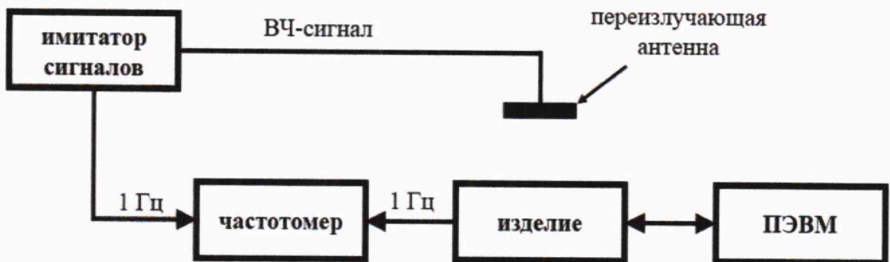
Рисунок 3 - Схема рабочего места

9.3.3 На имитаторе сигналов воспроизвести сценарий имитации с параметрами сигналов, указанными в таблице 3. После решения изделием навигационной задачи, записать на внешний накопитель частотомера 53230А не менее 100 значений расхождений шкалы времени изделия и шкалы времени имитатора сигналов.