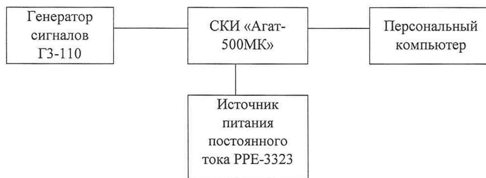
Рисунок 2– Схема подключения для определения приведенной погрешности систем СКИ «Агат-500МК» на диапазоне измерений от 200 Гц до 8000 Гц

10.3.1 Собрать схему как показано на рисунке 2.