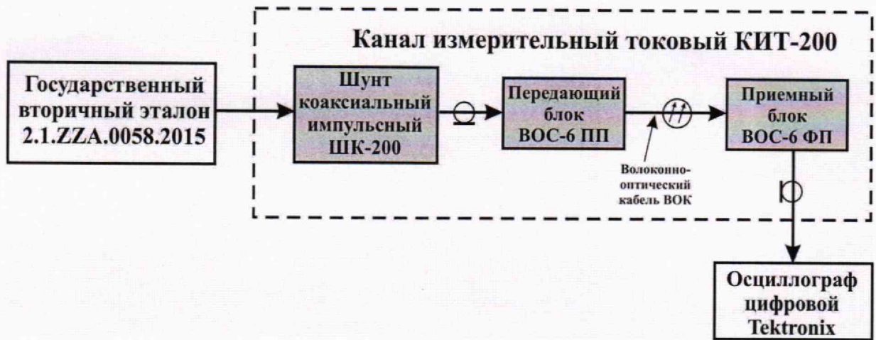
Рисунок 1 – Схема соединений при проведении опробования канала и проверки его метрологических характеристик

8.6 Воспроизводят импульс силы тока на выходе ВЭ 2.1.ZZA.0058.2015 с амплитудой I_{ВЭ.опр} , А, порядка 10 кА и обеспечивают с помощью осциллографа регистрацию импульсов напряжения на выходе канала. По полученной осциллограмме (см. рисунок 2) при помощи маркеров осциллографа определяют среднее значение амплитуды V_{ср.опр} , В, импульса.