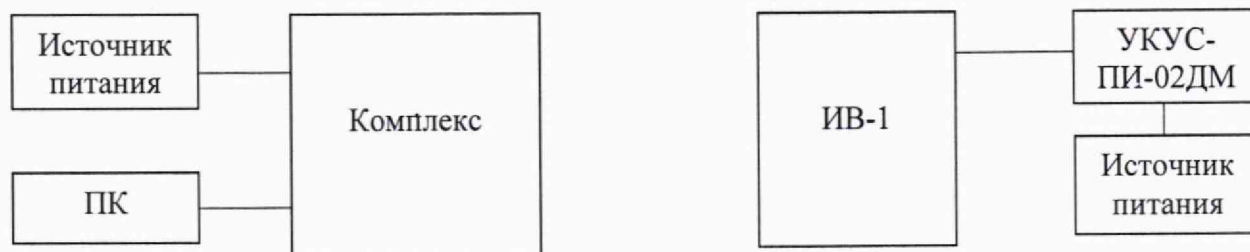
Рисунок 1 – Схема проведения измерений

10.1.1 Собрать схему в соответствии с рисунком 1.