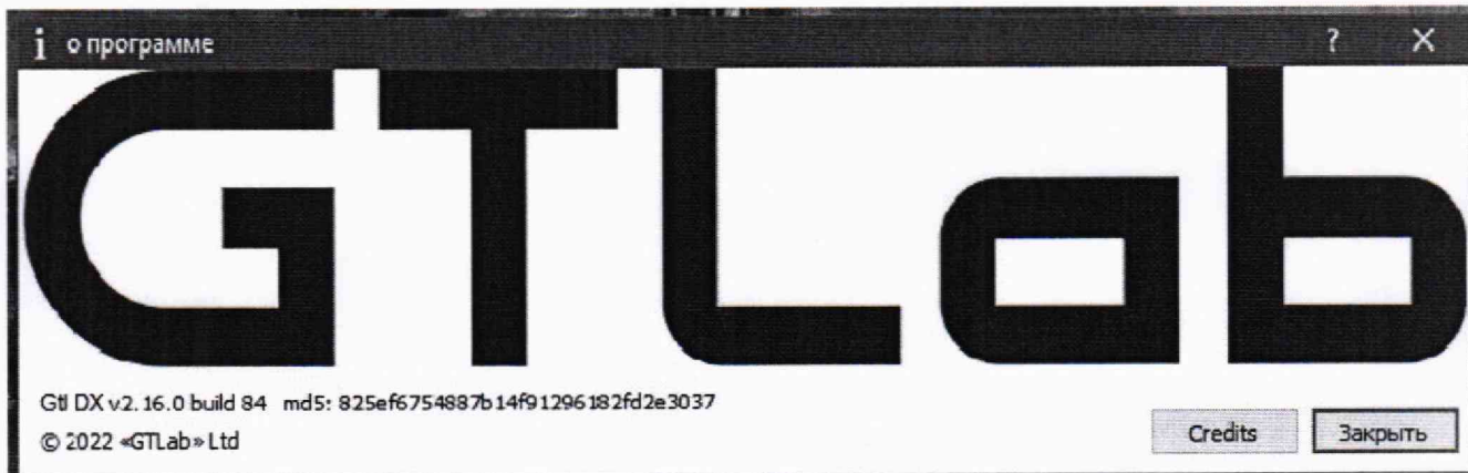
Рисунок 1 – Пример окна с информацией о ПО

9.2 Модуль считают прошедшим проверку с положительным результатом, если цифровой идентификатор ПО (контрольная сумма исполняемого кода) соответствует указанной в паспорте.