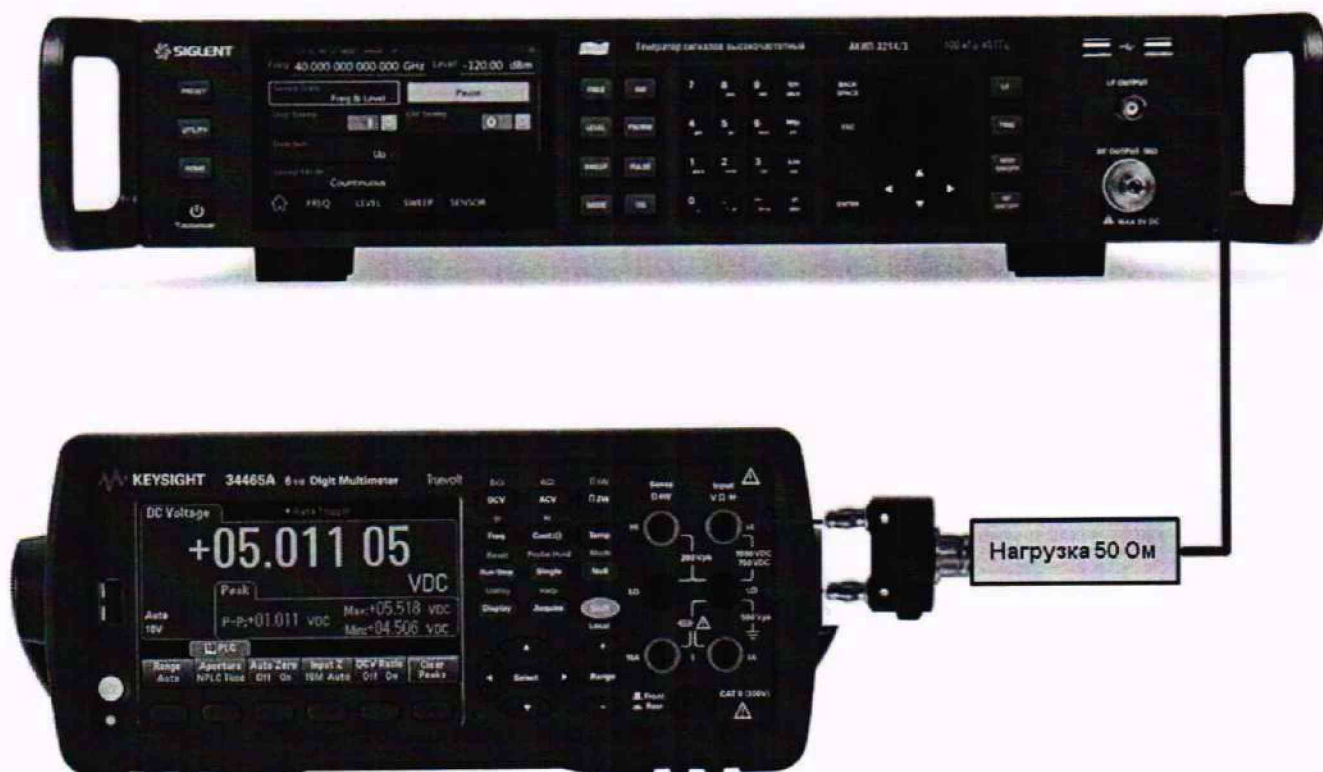
Рисунок 6 – Схема соединения приборов для определения погрешности установки уровня постоянного смещения

9.7.1 Подключить мультиметр к низкочастотному выходу генератора через проходную нагрузку 50 Ом в соответствии с рисунком 6.