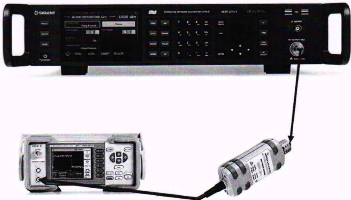
Рисунок 1 – Схема соединения приборов для определения погрешности установки выходного уровня генератора в диапазоне уровней от 0 до +13 дБм

Собрать измерительную схему в соответствии с рисунком 1.