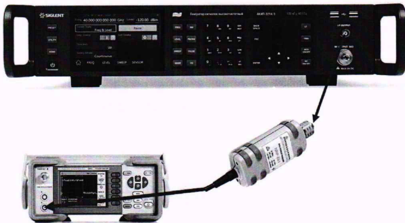
Рисунок 5 – Схема соединения приборов для определения неравномерности АЧХ встроенного НЧ генератора

9.6.1 Подключить преобразователь измерителя мощности к низкочастотному выходу генератора в соответствии с рисунком 5.