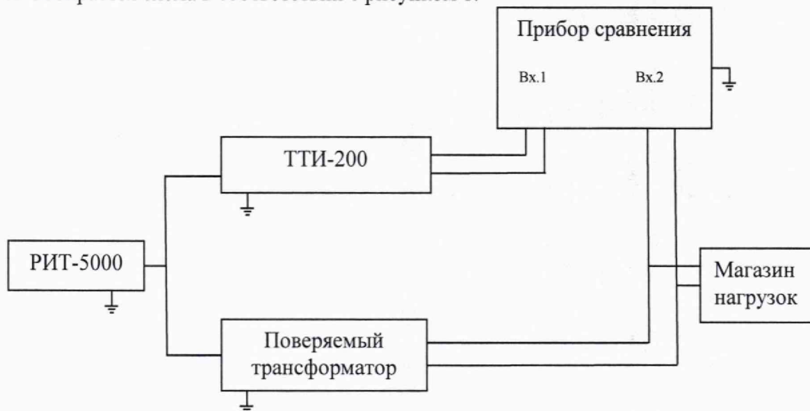
Рисунок 1 – Схема определения токовых и угловых погрешностей трансформаторов

9.1 Собирается схема в соответствии с рисунком 1.