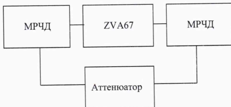
Рисунок 2 – Схема измерения начального ослабления

9.2.2.3 Измерить и занести в протокол полученные значения начального ослабления при обратном включении на частотах в соответствии с п. 9.1.1.8.