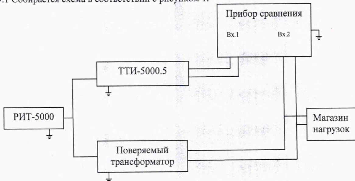
Рисунок 1 – Схема определения токовых и угловых погрешностей трансформаторов

9.1 Собирается схема в соответствии с рисунком 1.