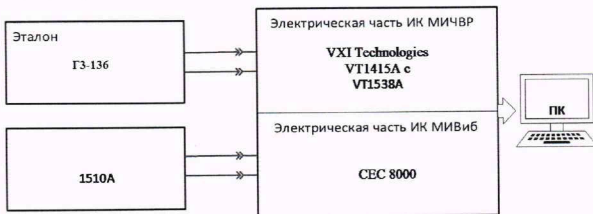
Рисунок 6 – Схема поверки ИК МИВиБ

для чего ко входам электрической части ИК МИВиБ и ИК МИЧВР подключить средства поверки, выбранные в соответствии с Таблица 2 настоящей МП.