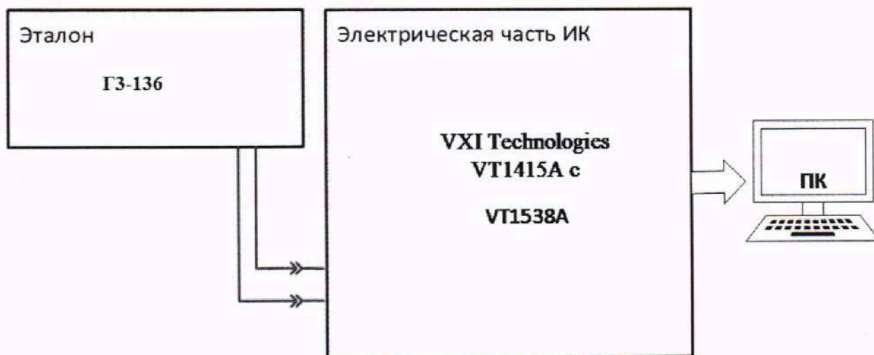
Рисунок 8 – Схема поверки ИК МИЧВР

9.6.1 Собрать схему поверки в соответствии со схемой поверки (Рисунок ), для чего ко входу ПП подключить средство поверки, выбранное в соответствии с Таблица 2 настоящей МП.