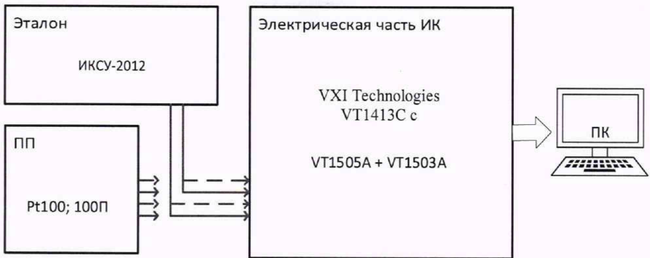
Рисунок 4 – Схема поверки ИК МИТ с ПП терморезистивного типа