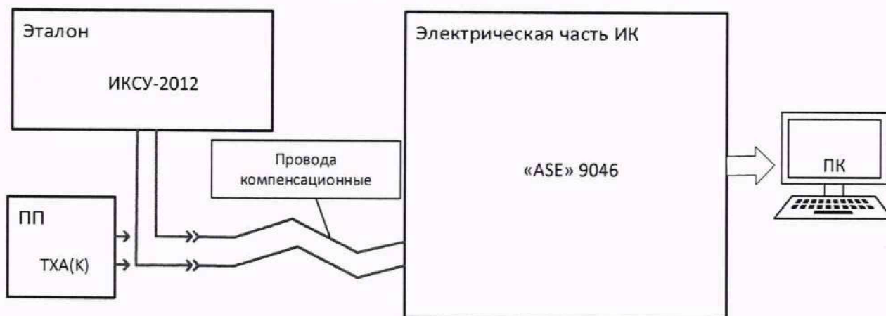
Рисунок 3 – Схема поверки ИК МИТ с ПП термоэлектрического типа

для чего на вход электрической части ИК (к кабельной линии), вместо ПП, подключить средство поверки, выбранное в соответствии с Таблица 2 настоящей МП.