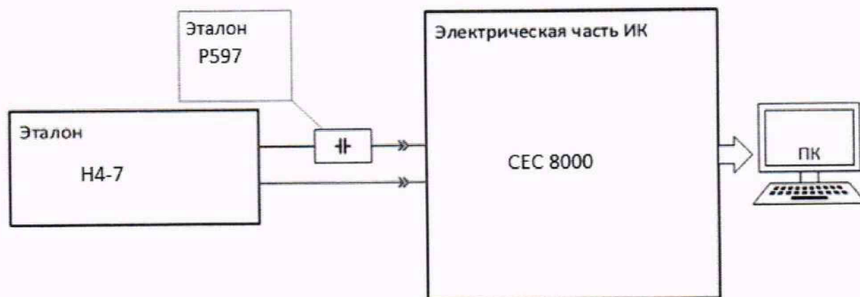
Рисунок 7 – Схема поверки ИК МИВиБ при использовании меры емкости и генератора напряжения переменного тока