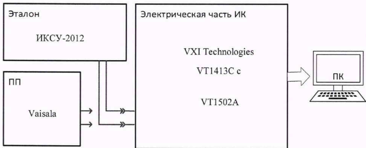
Рисунок 5 – Схема поверки ИК МИТ с ПП с унифицированным токовым выходом

9.4.2.2 С помощью средства поверки задать на вход электрической части ИК последовательность из нескольких контрольных значений электрического сигнала, соответствующих температуре, равномерно распределенных по диапазону измерения ИК включая нижнее и верхнее значения, и произвести регистрацию/запись показаний.