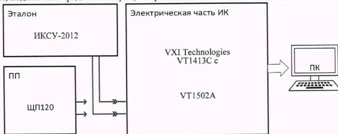
Рисунок 10 – Схема поверки ИК МИНЧС

9.8.2.1 Собрать схему поверки электрической части ИК в соответствии со схемой поверки (Рисунок ) для чего на вход электрической части ИК (к кабельной линии), вместо ПП, подключить средство поверки, выбранное в соответствии с Таблица 2 настоящей МП.