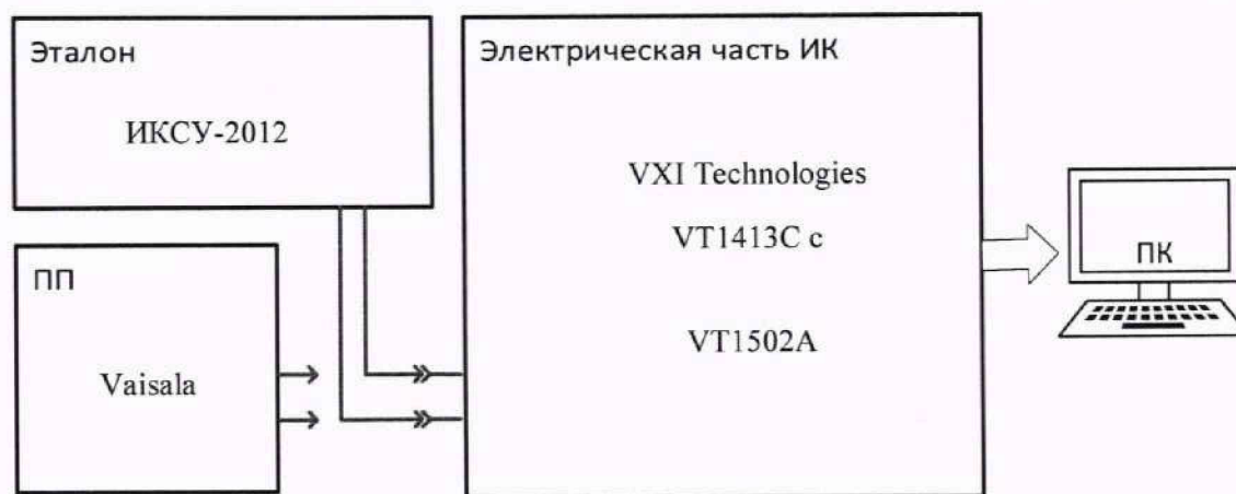
Рисунок 9 – Схема поверки ИК МИВ

9.7.2.1 Собрать схему поверки электрической части ИК в соответствии со схемой поверки (Рисунок ) для чего на вход электрической части ИК (к кабельной линии), вместо ПП, подключить средство поверки, выбранное в соответствии с Таблица 2 настоящей МП.