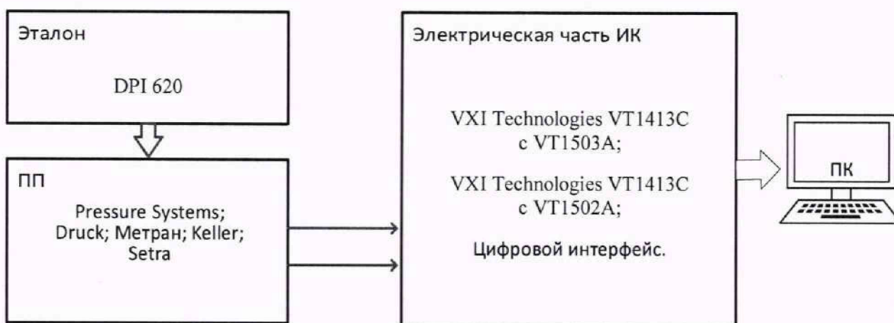
Рисунок 2 – Схема поверки ИК МИД

9.3.2 Собрать схему поверки в соответствии со схемой поверки (Рисунок 2), для чего ко входу ПП подключить средство поверки, выбранное в соответствии с Таблица 2 настоящей МП.