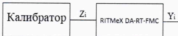
Рисунок 1 - Схема подключения для определения основной приведенной погрешности каналов измерения сигналов напряжения постоянного тока.

9.2 Определение основной приведенной погрешности воспроизведения сигналов напряжения постоянного тока.