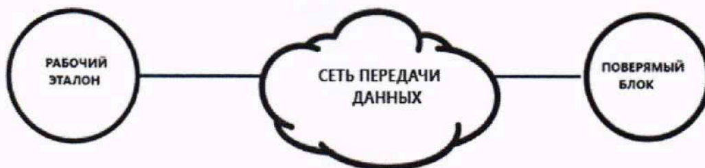
Рисунок 3 – Схема измерений диапазона и абсолютной погрешности измерений количества информации (объема данных)

10.6.2 Выполнить действия согласно п.п. 10.1.1 - 10.1.3