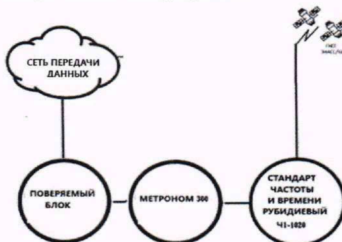
Рисунок 2 – Схема измерения погрешности измерения разности (расхождения) шкал времени

10.5.1 Собрать схему в соответствии с рисунком 2.