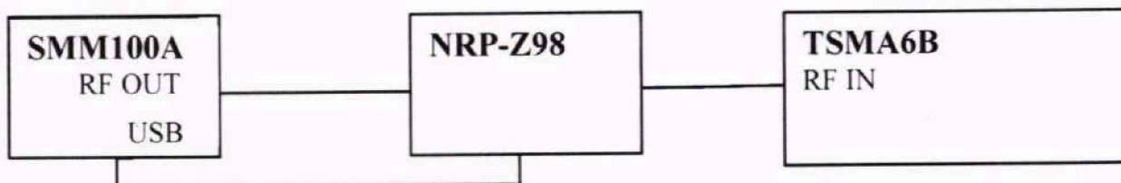
Рисунок 2 - Структурная схема соединения средств измерений для определения абсолютной погрешности измерений уровня мощности входного сигнала минус 20 дБ (1 мВт)

Выполнить соединение приборов по схеме, представленной на рис. 2.