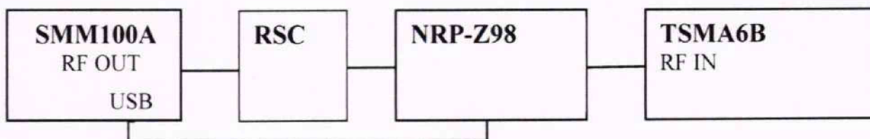
Рисунок 3 - Структурная схема соединения средств измерений для определения абсолютной погрешности измерений уровня мощности входного сигнала в диапазоне от минус 20 до минус 120 дБ (1 мВт)

Выполнить соединение приборов по схеме, представленной на рис. 3.