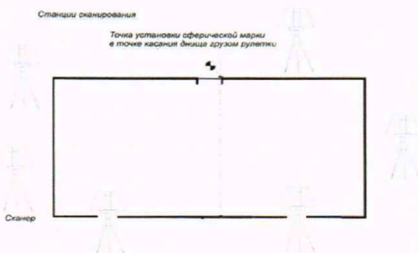
Рисунок А.3 - Схема сканирования внешней поверхности резервуара