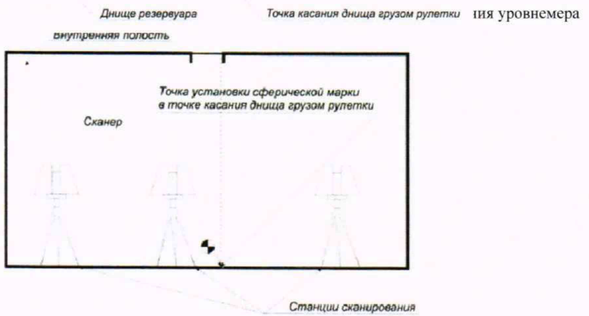
Рисунок А.2 - Схема сканирования внутренней полости резервуара