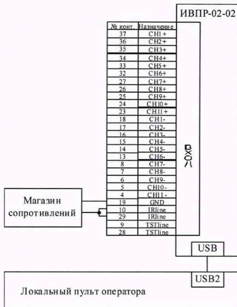
Рисунок Г.2 Схема соединения приборов при определении погрешности каналов измерения сопротивления ИВПР-02-02